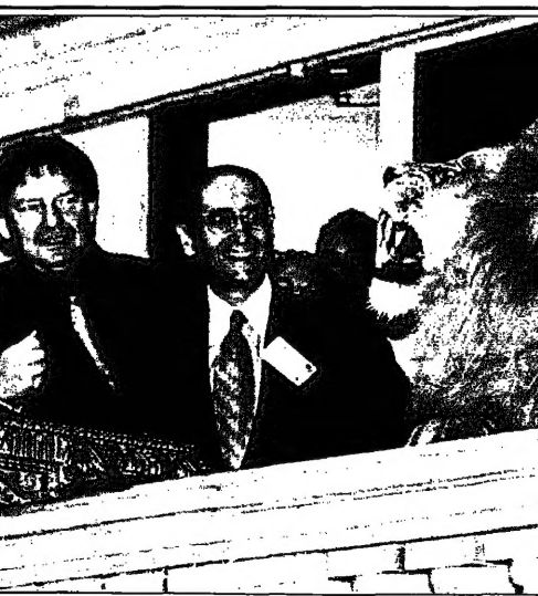
رئيس مؤسسة تمويل الحياة العالمية للتأمين المالية في الرياض يشرح لرجال الأعمال السعوديين في اجتماع مشترك في الرياض.

الرياض - من علي بوزرد قال محللون بمؤسسة تمويل الحياة العالمية للتأمين المالية في الرياض ان بورصة الرياض ستزيد بنسبة 33 في المئة في عام 1998. وقال مدير العلاقات العامة للمجلس السعودي ان المؤتمر يهدف الى تعزيز العلاقات التجارية بين البلدين.